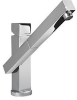
Mitigeur Twix Plus