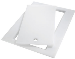
Planche de découpe Twin in HDPE 8644 101