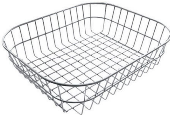
Panier en acier inoxydable 8611 000